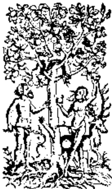
Rosengewächse begegnen uns schon im Paradiesgarten. Apfelbaum; aus Lonicerus, Kreuterbuch (1679).

In dem uralten Glauben an die Fruchtbarkeit spendende Kraft dieser Gewächse wurzelt aber noch ein weiterer Brauch, der in katholischen Gegenden zu Mariä Himmelfahrt gepflegt wird: Die Kräuterbündel, die am 15. August zur kirchlichen Weihe getragen werden, sind oftmals mit Wunschketten aus aneinander gereihten Ebereschen-