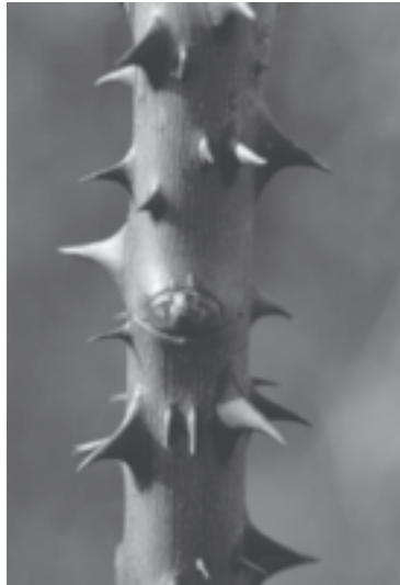
In der Heckenrose wohnt ein schützender Pflanzengeist.

auch in der Frauenheilkunde: Bereits in der Antike stellten die Ärzte aus dem kostbaren Rosenöl Mutterzäpfchen für Gebärmutterleiden her – welch venusische Arznei für das weiblichste Organ! Innerlich verabreichten sie Rosenblütenwein bei Schmerzen aller Art und schätzten die Rosenmedizin als Herz- und Nerventonicum.