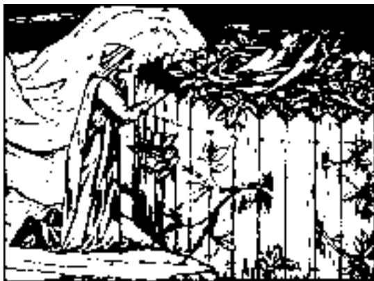
Rosengarten; Holzschnitt von Edward Burne-Jones.