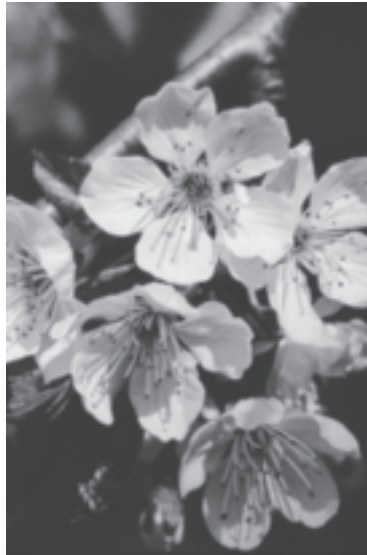
Die zarten Kirschblüten duften betörend und lassen bereits ahnen, dass der Kirschbaum eine Circe in Baumgestalt ist. (© Margret Madejsky)

zip. Daher symbolisiert die Rose die mystische Vereinigung von Weiblichem und Männlichem ( Unio mystica ).