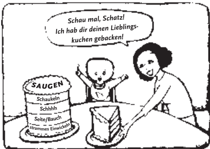
Ein Schichtkuchen aus Beruhigung und Geborgenheit

Anmerkung: Das stramme Einwickeln an sich reicht zum Beruhigen oft noch nicht aus, bereitet Ihr Baby aber darauf vor, sich auf die nächsten »Schichten« zu konzentrieren, die dann den Beruhigungsreflex auslösen.