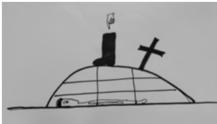
Zeichnung Maja, 6 Jahre

Das Bild einer Zeichnung blendet sich ein, die ich einmal als Kind gemalt habe. Es zeigt die psychisch empfundene Wahrheit meiner Kindheit, die ich verdrängt habe.