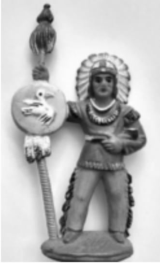
Häuptling »Weiße Feder«

Während er mit meiner Stimme redet, spüre ich eine sehr ruhige, kraftvolle Präsenz in mir, die meine tief empfundene Ohnmacht aufhebt.