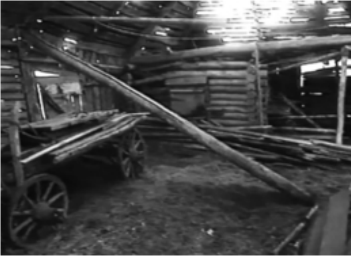
Scheune in Lipowka

blick springt sie sogleich zurück. Ihre panische Angst vor Menschen bringt uns beide in einen Zwiespalt, denn ich kann mich ja nicht entfernen, weil die anderen Hunde mich brauchen und sich angstvoll an mich drängen. Ich weiß nicht, was Alma mit menschlichen Wesen erlebt hat, aber offensichtlich will sie auf keinen Fall mit ihnen in einem geschlossenen Raum sein. Ich kann nichts anderes tun, als mich vollkommen ruhig zu verhalten und sie nicht anzusprechen, denn eine direkte Kontaktaufnahme würde sie noch mehr ängstigen.