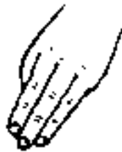
Abb. 2: Fingerhaltung bei der Massage der bioaktiven Punkte

Die Massage wird mit drei Fingern ausgeführt: dem Zeige-, dem Mittel- und dem Ringfinger (zwanzig bis fünfundzwanzig Bewegungen auf jedem Punkt). In Abb. 2 können Sie sehen, wie die Finger ausgerichtet sind. Es kann auch nur der Daumen benutzt werden. Abb. 3 zeigt, wie das geht.