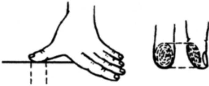
Abb. 3: Ausrichtung beim Pressen der bioaktiven Punkte

Sie dürfen die Finger nie in den Körper »stoßen«. Massiert wird mit den Fingerbeeren, die Bewegungen sind streng vertikal ausgerichtet, und bitte nicht reiben. Massieren Sie so stark, dass eine Empfindung entsteht, die angenehm bis leicht schmerzhaft ist.