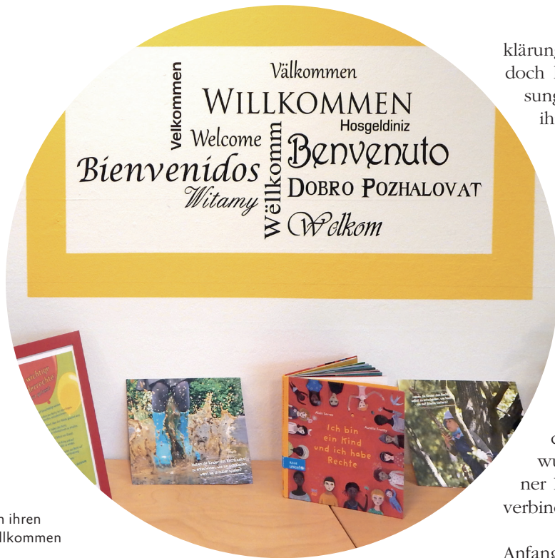
Die Kinder in ihren Sprachen willkommen heißen

Generell sind die Teilhabemöglichkeiten von Kindern in vielen gesellschaftlichen Bereichen begrenzt; ihre Meinung wird nur selten wahrgenommen oder gar bei Entscheidungsprozessen berücksichtigt. Auch in einem privilegierten Land wie Deutschland ist die Mängelliste lang. Die konsequente Umsetzung der Kinderrechte auf allen gesellschaftlichen Ebenen muss die Chancengleichheit aller Kinder zum Ziel haben – und hat daher an Aktualität nicht verloren.