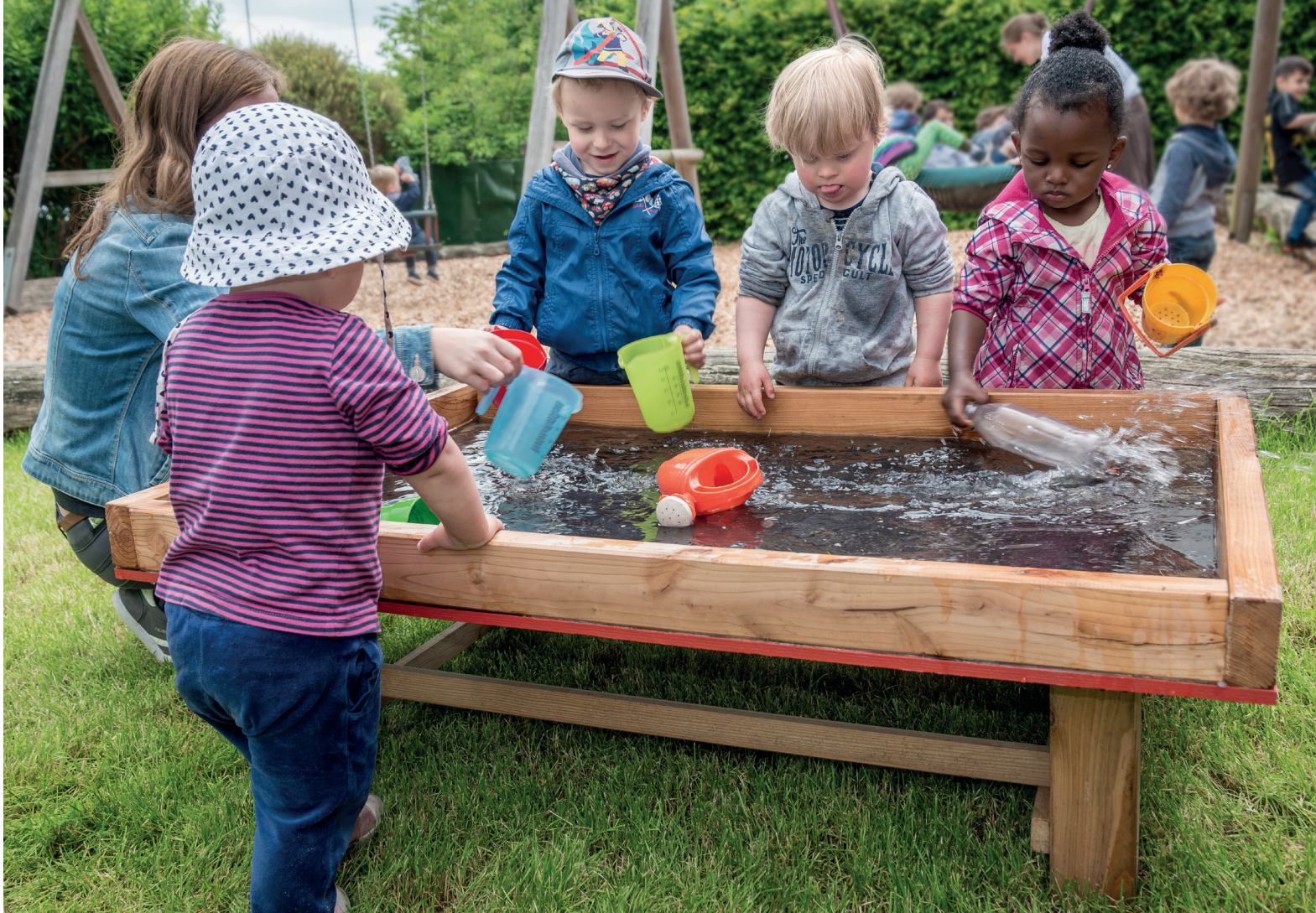
Gleiche Rechte für alle Kinder