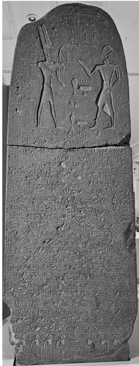
Abb. 1: Stele von Ramses II. aus Bet-Schean. Pennsylvania University Museum (No. 29.107.958)

Das sich nun ergebende Problem waren die Handelsbeziehungen mit dem Norden. Die traditionelle Straßenverbindung zwischen Ägypten und Mesopotamien bzw. Kleinasien verläuft entlang des Nordrandes der Sinaihalbinsel, folgt dann in etwa dem Verlauf der Mittelmeerküste, überwindet den Karmel (meist bei Megiddo), durchquert Untergaliläa und erreicht schließlich den See Gennesaret. Von dort aus verläuft sie in nördlicher Richtung über Hazor und die Beqa'-Ebene mit Qadesch am Orontes nach Nordsyrien bis zum Eufkrat. Nun aber kontrollierten die Hetiter Qadesch am Ausgang der Beqa'-