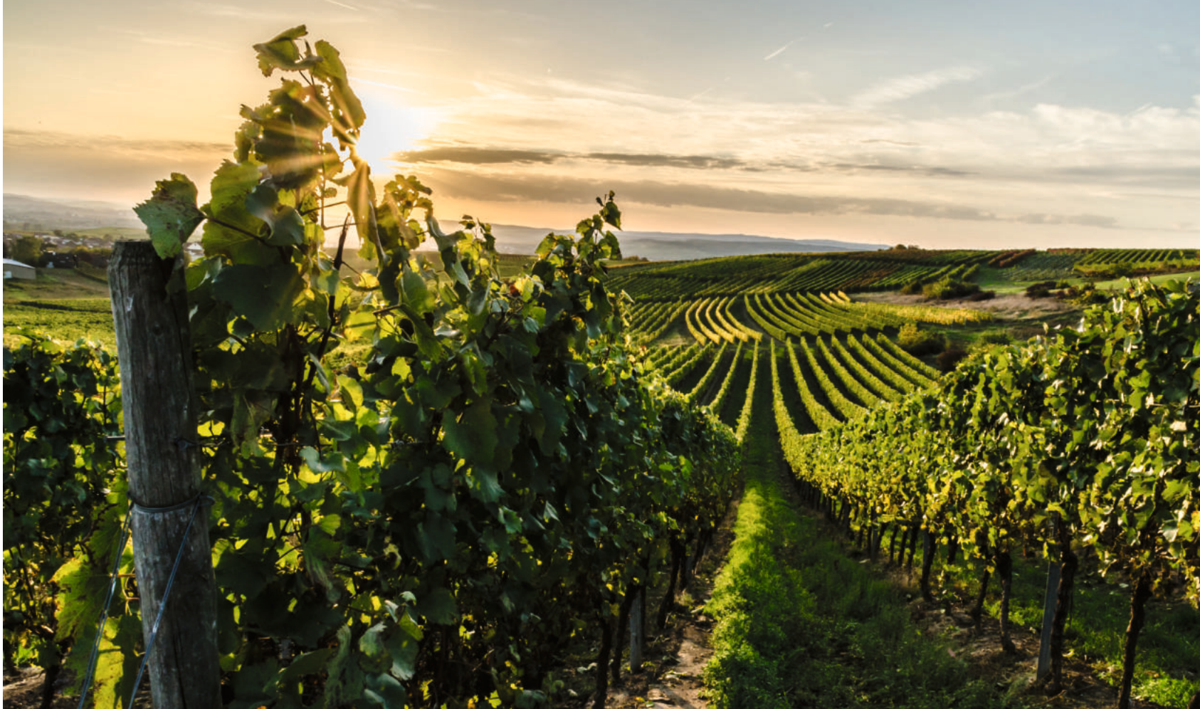
Wein als Verheißung: Das Wunder auf der Hochzeit von Kana sagt: Unser schales Leben kann zur festlichen Freude werden.

ich positiv in Begegnungen gehe und nicht immer nur auf das Negative schaue. Schon in biblischen Zeiten sehen wir übrigens: Die Juden haben in schwierigsten Situationen ihre Feste gefeiert und daraus Hoffnung bezogen. Feste haben mit Freude zu tun. Manche sagen heute: „Ich kann nicht Weihnachten oder Ostern feiern, solange die Welt derart im Argen liegt.“ Ich halte dagegen: Gerade deswegen ist es so wichtig, eine andere Welt dagegenzusetzen.