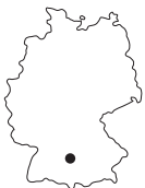
Wegkapelle Unterliezheim Mühlstraße 89440 Lutzingen