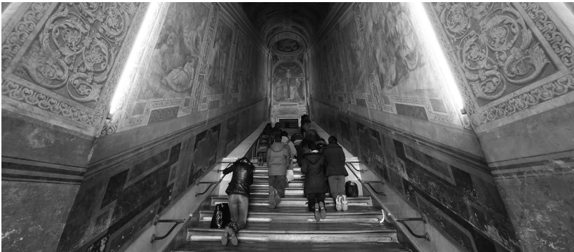
Heilige Stiege erstmals seit 300 Jahren wieder freigelegt

Auf dieser Internetseite finden Sie wichtige Informationen zur Heiligen Treppe in Rom, die Helena, die Mutter von Kaiser Konstantin um das Jahr 326 der Legende nach in Jerusalem gefunden und nach Rom hat bringen lassen. Auf dieser Treppe soll Jesu Kreuzweg begonnen haben. Die Treppe führte von Pontius Pilatus aus zur Kreuzigungsstätte. Zusammen mit der Treppe sollen auch das Kreuz Christi und sein ungenährter Leibrock gefunden worden sein.