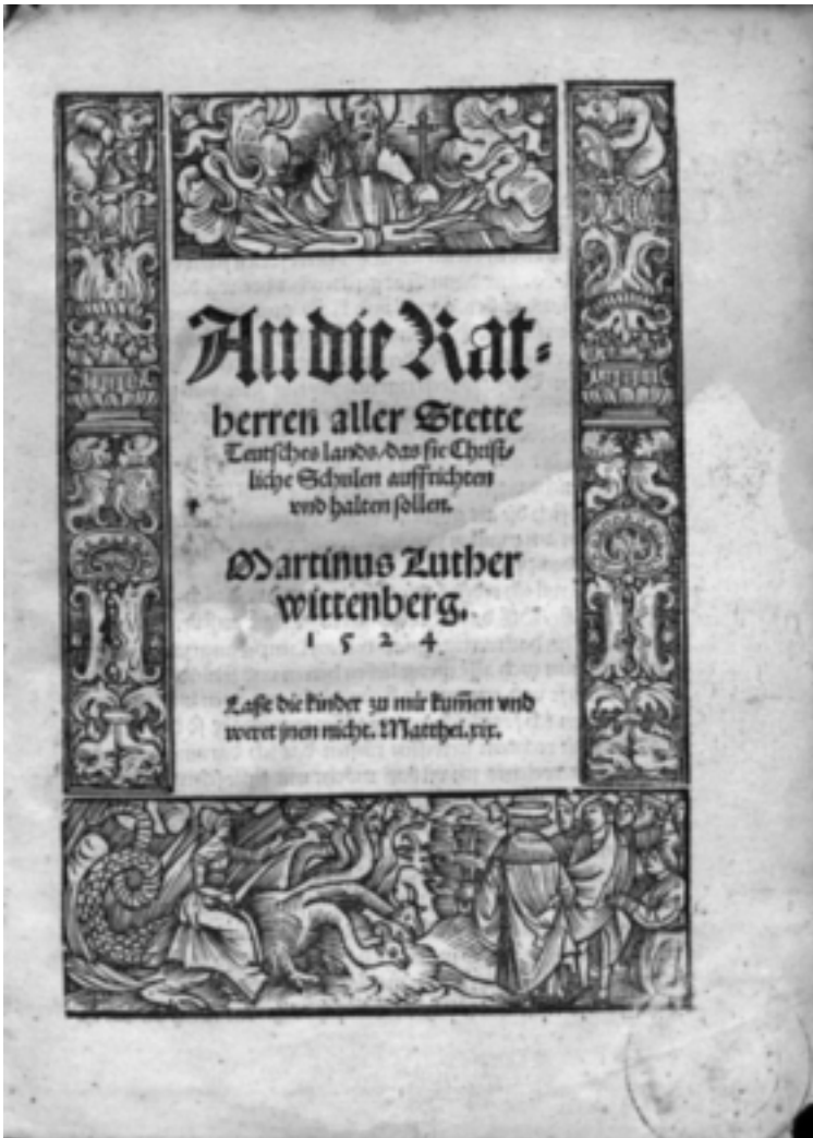
Abb. 3: Druck von Jobst Gutknecht in Nürnberg, 1524, VD 16 L 3797, Exemplar der Staatsbibliothek zu Berlin, Sign. 19 ZZ 6355, http://resolver.staatsbibliothek-berlin.de/SBB00016E4A0000000 .