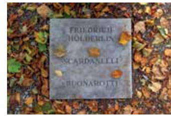
Gedenkstein in Nürtingen