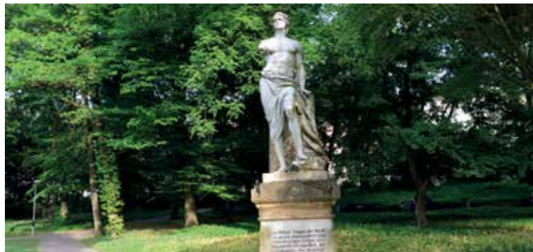
Hölderlindenkmal im Alten Botanischen Garten Tübingen