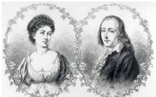
Friedrich Hölderlin und Susette Gontard, Holzstich um 1870