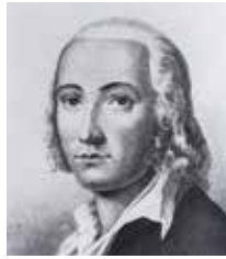
Porträt von Friedrich Hölderlin

„Hölderlin traut der Stille viel zu: er hat den Büchern damit einfach eine feste Qualität zugesagt. Und dank der zufallsfreien Genauigkeit seines Sprachgebrauchs wird man Zeuge, wie dieses Wort an sein Ziel gelangt, wie es genau als dasselbe Wort zur Wirkung kommt, die ein Wort haben kann, nämlich zur vermittelnden.“