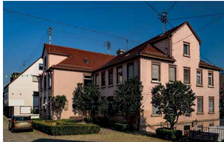
Hölderlins Elternhaus in Nürtingen