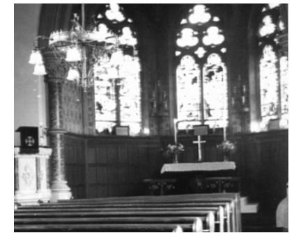
Kanzel und Altar der deutschen evangelischen Gemeinde in Sydenham

In diese Zeit fiel auch die von Bonhoeffer lang ersehnte Einladung von Mahatma Gandhi nach Indien. Bonhoeffer hatte schon lange den Wunsch geäußert, für eine Zeit nach Indien zu gehen und bei Mahatma Gandhi zu leben und dessen geistiges und politisches Wirken lebendig zu erleben. Bonhoeffer entschied sich jedoch gegen die Reise nach Indien und begann ab März 1935 mit dem Aufbau der Predigerseminare der Bekennenden Kirche in Deutschland.