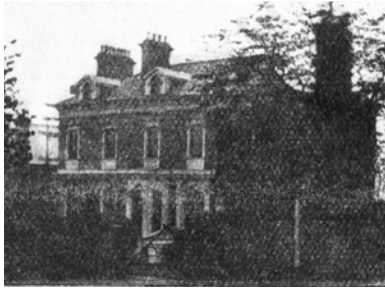
Bonhoeffers Pfarrhaus in Sydenham. Im 1. Stock befand sich seine Wohnung.

Von November 1933 bis März 1935 war Dietrich Bonhoeffer Pfarrer in London-Sydenham. Das Pfarramt in London zu übernehmen, war eine schwierige Entscheidung für ihn. Am 24. Oktober 1933 schrieb er dazu – angesichts der Auseinandersetzungen in der deutschen Kirche nach dem Machtantritt der Nazis und der geplanten Gleichschaltung der Kirche mit dem Regime und auch der innerkirchlichen