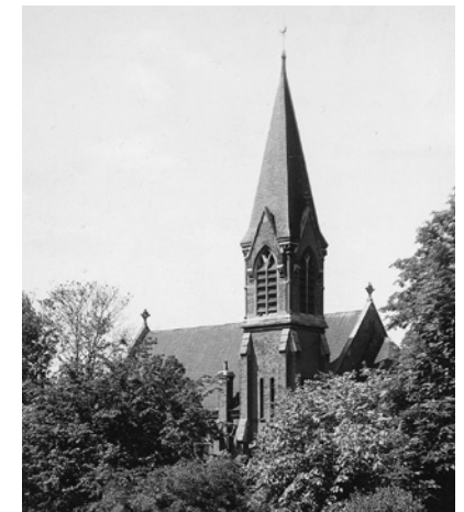
Bonhoeffers Kirche in Sydenham, 1937