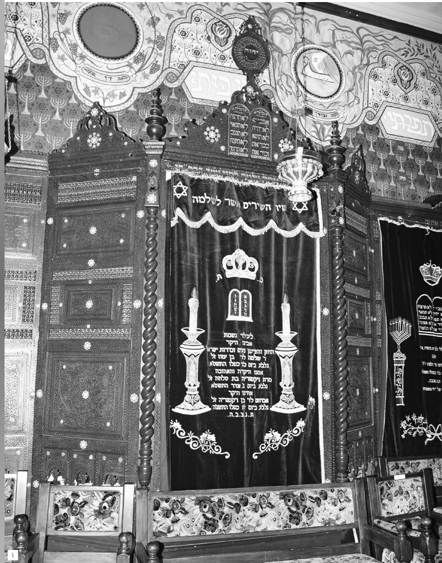
1 Toraschrein der A'edes-Synagoge in Jerusalem 2 Toraschrein der Abuhav-Synagoge in Safed 3-5 Fähnchen und Wimpel, mit denen Kinder die Umzüge zum Fest Simchat Tora begleiten

In den Synagogen liest man an diesem Tag, der meist im Oktober liegt, den letzten Abschnitt des Buches Deuteronomium. Der erzählt vom Tod des Moses. Danach aber beginnt man gleich wieder von vorn mit Genesis 1: „Im Anfang erschuf Gott Himmel und Erde.“ Ende und Neubeginn in einem Atemzug – irgendwie passt das zur einzigartigen Geschichte dieses einzigartigen Volkes. Auch wir Christen dürfen mitfeiern: Nach jedem Schluss schenkt Gott einen neuen Anfang.