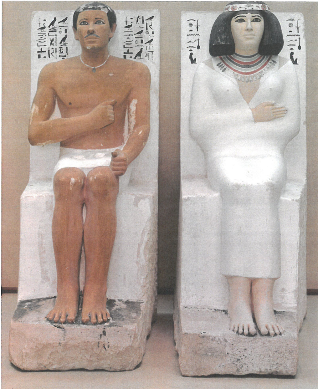
Statuengruppe des Prinzen Rahotep und seiner Frau Nofretete. Bemalter Kalkstein, um 2620 v.Chr. Ägyptisches Museum Kairo