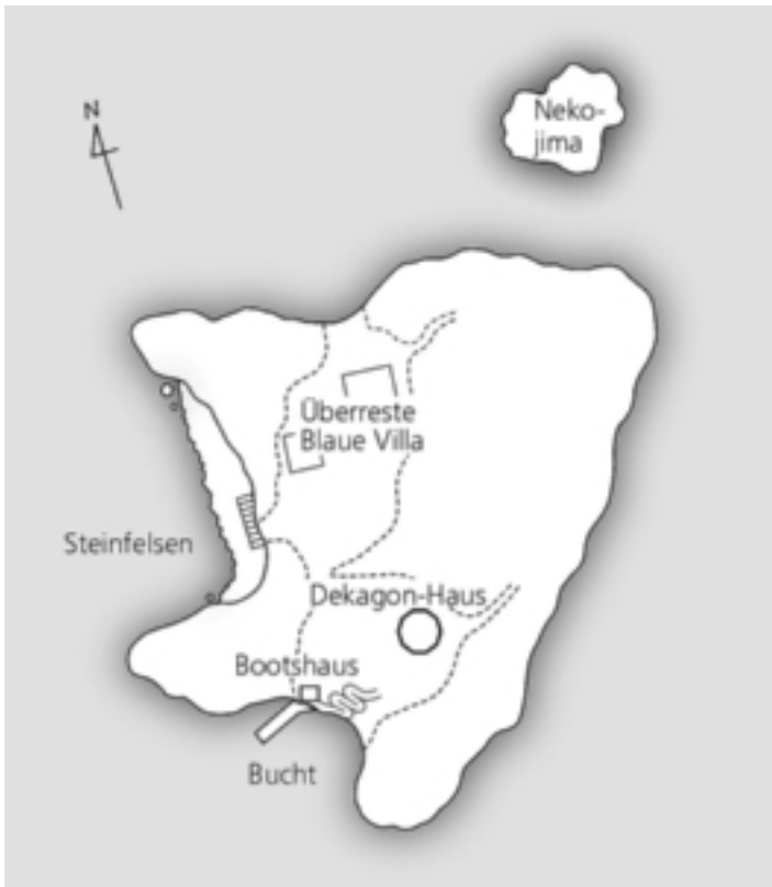
Abb. 2 Übersichtskarte Tsunojima

Van schüttelte den Kopf. »Mein Onkel hat mir zwar einiges erzählt, aber an der Ruine bin ich auch zum ersten Mal. Als ich heute Morgen ankam, war ich erst mal mit dem Gepäck beschäftigt, und als dann das Fieber losging, hatte ich keine Lust, die Insel alleine zu erkunden.«