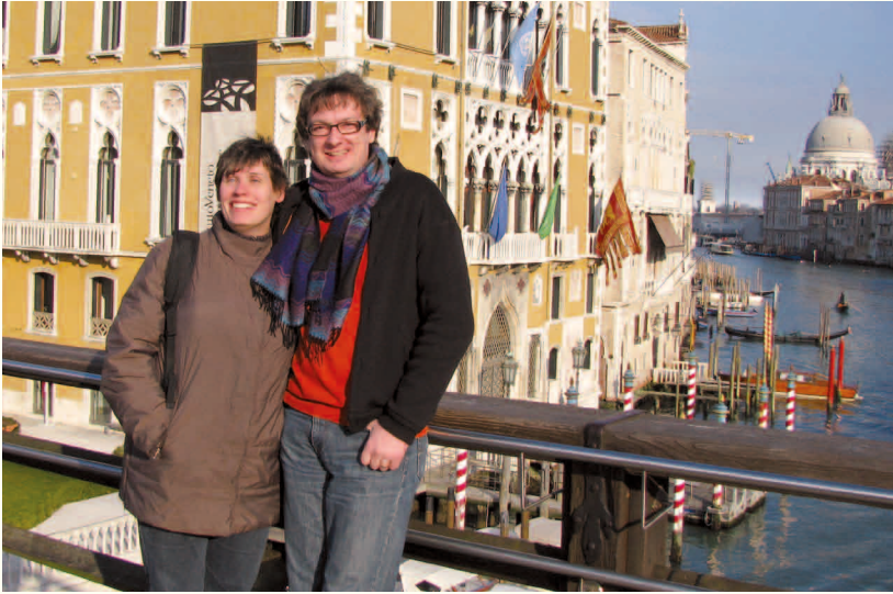
Am Canal Grande in Venedig