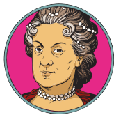
Mehr zu Aemilie Julianes Leben ab Seite 96

allem Aufgaben zu erfüllen, die sich aus ihrer biologischen Fähigkeit ableiteten, Kinder zu kriegen. Die Reformation änderte lange Zeit nichts daran, dass Frauen nicht Pfarrerinnen werden durften. Erst über 400 Jahre nach der Reformation wurde die erste Frau zur Pfarrerin ordiniert. Aber auch bis dahin gab es viele protestantische Frauen, die sich sehr wohlfühlten in der Rolle, die ihnen ihr Glaube und die Gesellschaft zusprachen. Aemilie Juliane von Schwarzburg-Rudolstadt zum Beispiel war eine Gräfin, die um 1700 herum lebte und der es bestimmt nicht eingefallen wäre, ihren Mann in Erziehungsurlaub zu schicken, damit sie die Geschäfte führen kann. Sie war aber ausgesprochen bedacht darauf, dass sie selbst und die Frauen in ihrer Umgebung eine ausgesprochen gute Bildung bekamen. Sie wollte diejenigen widerlegen, die meinten, dass „Weibsbilder zum Studieren keineswegs tüchtig seinen“. Wie hätte sie wohl die Frage danach beantwortet, was Frauen besser können als Männer?