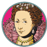
Mehr zu Elisabeths Herrschaft ab Seite 202

Oft haben sich Frauen als ausgesprochene Organisationstalente einen Namen gemacht. Häufig war es vor allem der eigene Haushalt, den sie mit Geschick führten, wie bei Katharina von Bora, ohne deren Umsicht Martin Luther wohl frühzeitig bankrott gewesen wäre. Es konnte aber auch vorkommen, dass eine Frau ein ganzes Weltreich zu führen und zu organisieren hatte, wie Elisabeth I. von England im 16. Jahrhundert. Elisabeth machte England endgültig zu einem protestantischen Land und führte es in den Krieg gegen das